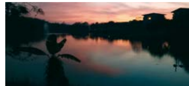
Жилые корпуса на рассвете