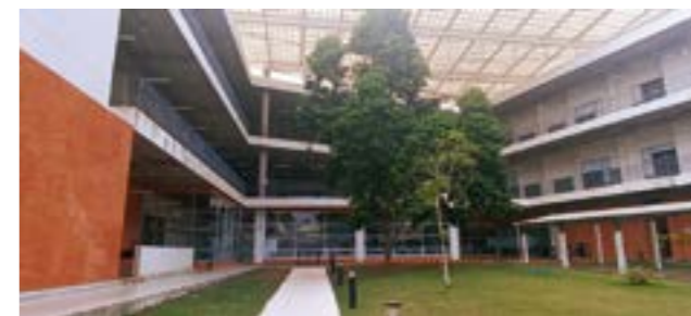
Внутренний двор в школе