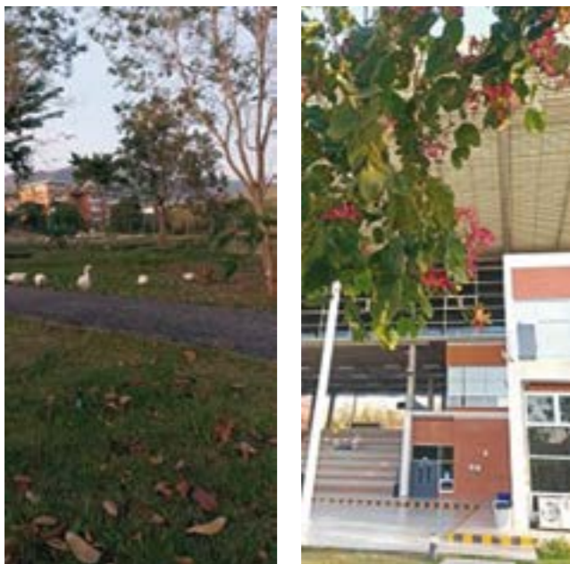
Гуси в школе