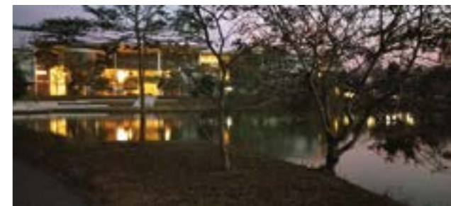
Школа рано утром