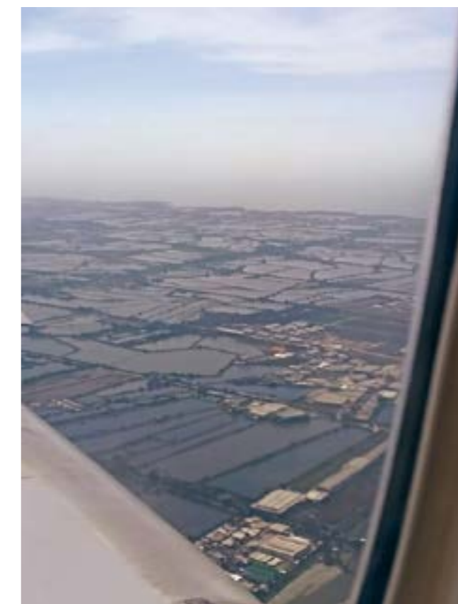
Рисовые поля рядом с Бангкоком

отоспаться в долгой дороге, но, оказывается, редко кому это удаётся. И всё же, как мне кажется, нам всем получилось урвать несколько часов неудобного, поверхностного, но удивительного по геолокационным характеристикам — на высоте 10 000 метров над землёй — сна. Мы — небожители.